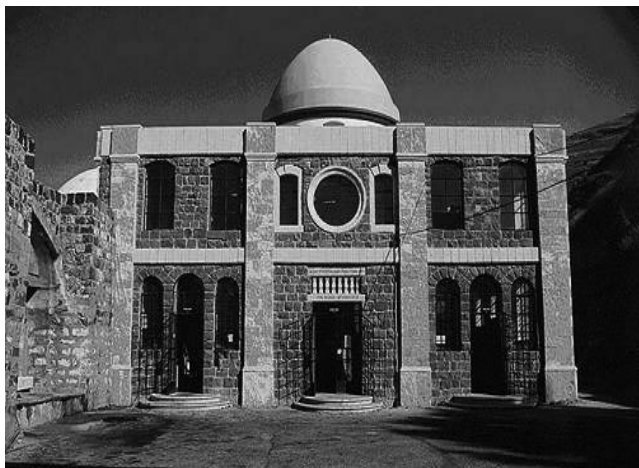
ציון רבי מאיר בעל הנס זיע"א מקום בו התגלה הפתק הקדוש

בשנת תרפ"ב, בשבעה עשר בתמוז, הרגשתי חלשה גדולה, הפעל דבר התגבר עלי בפקר ואמר, הרי אתה חלש מאד! אתה צריך לאכול! ואני לא שתיתי ולא אכלתי מחצות לילה עד אותו הבקר, אבל אכלתי, מחמת חשש כמו שאוכלים דברים מזיקים, אבל בלא ידים ובלא רגלים. אחרי האכילה ברכתי המזון והלכתי למקוה, אפשר להבין