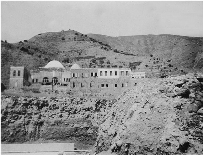
ציון רבי מאיר בעל הנס זיע"א בין ההרים

מֵרַב הַשְּׂתוֹקְקוֹתֵי שְׁהָיָה לִי מִן הַסִּפְרָה הַזֹּאת, הָיָה אֶצְלִי תָמִיד כְּמוֹ דְּבַר חֲדָשׁ, וְהָיִיתִי מְסִימוֹ וְחוֹזֵר וּפּוֹתְחוֹ וְלוֹמֵד בּוֹ תָּמִיד, וְהוּא הִצִּילֵנִי מִכָּל רָע, וְנִתְגַּלָּה לִי מִמֶּשׁ אֹר חֲדָשׁ, וְהִרְגַּשְׁתִּי בְּעֶצְמִי שְׁנִשְׁתַּנִּיתִי שְׁנוֹי גְּדוֹל, בְּרַחוּק שָׁמַיִם מֵאַרְצִי. וְאַרְעֵל־פִּי שְׁלֵא יִדְעֵתִי מִי הוּא מְחַבֵּר הַסִּפְרָה הַזֹּאת, הֲרִי הַפְּעֻלוֹת שְׁלוֹ עָלַי הָיוּ טוֹבוֹת וְנִפְלְאוֹת.